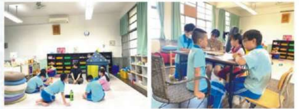
▲ 小團體輔導 - 情緒團體、自我成長團體、性別平等團體、人際關係團體、新住民子女團體 ...