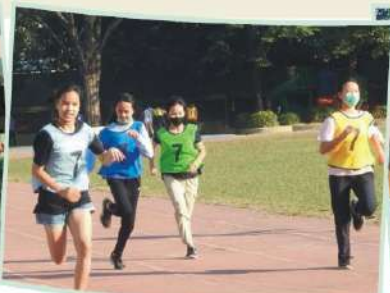
體育競賽_個人賽決賽