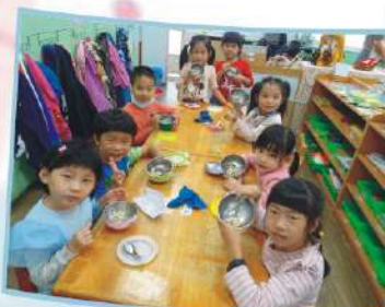
美味米料理之 金沙黑米麩球。