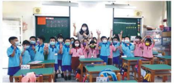
▲ 班級輔導 - 將心比心·感同身受

輔導老師的主要工作為提供學生個別輔導、小團體輔導、班級輔導等服務，同時也進行學生周遭的資源整合與親師諮詢合作，同時也會跨領域與特教老師甚至是醫療體系進行整合式的方法，一起為學生提供更完整的學習處遇、提升學生身心健康。