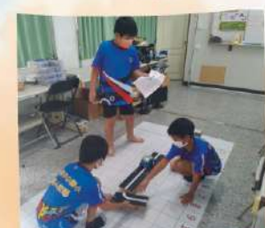
創意機器人挑戰賽