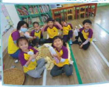
將稻殼填充至襪子 裡，做成聖誕雪人