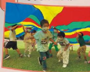
認識我的五官和身 體，動動手腳，保 持健康。

中小班的30個可愛寶貝，快樂的在茉莉園地裡探索自己、認識自己以及學習照顧自己，同時學習與人分享、輪流、等待、溝通協調、解決衝突等團體規範與社會技巧。瞭解自己姓名意涵及家人的用心，認識五官和身體並學習善用與照顧它，探索內心的情緒並思考如何幫助自己緩解不舒服的心情。現在的我們，更喜歡自己了，也明白尊重和分享愛的重要性。