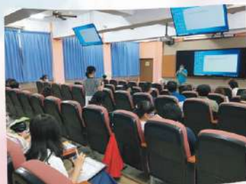
特教研習-自閉兒同 學齡期的陪伴之路