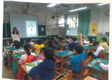
特殊教育入班宣導