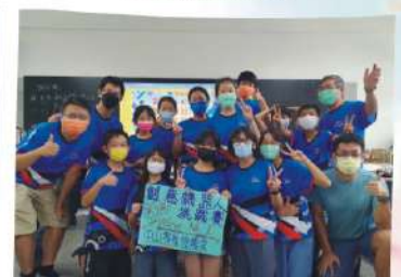
創意機器人挑戰賽