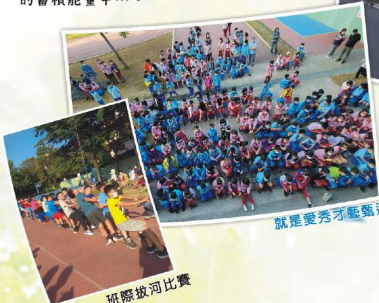
就是愛秀才藝甄選