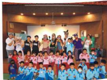
生命教育戲劇欣賞-狗狗天堂