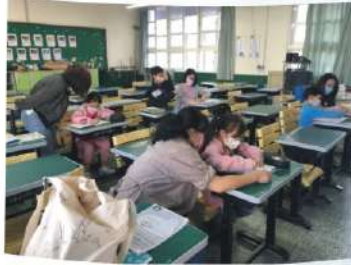
愛心課輔志工輔導 低年級學童課業