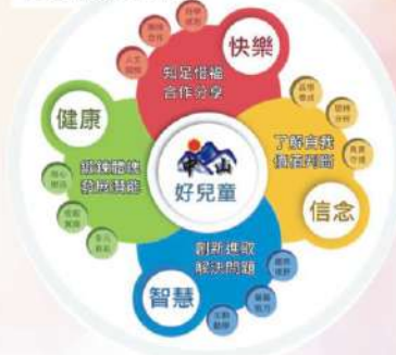
中山國小學生圖像