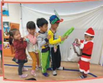
故事演出「勇敢小火車」 唸完不害怕咒語，幫助勇 氣提昇，遇到困難不放棄 ，我是不怕小勇士。