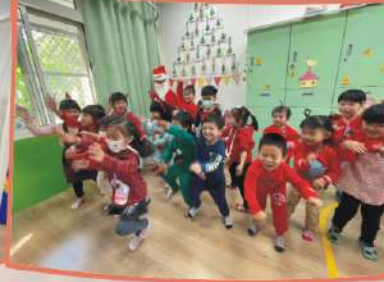
以歌聲、舞蹈和交換 禮物的活動，學習聖 誕公公快樂分享「 愛」