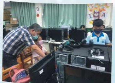
學習扶助老師 指導學童學習