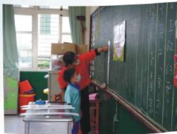
小一注音符號闖關