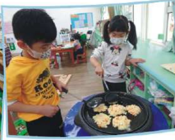
健康又美味的米餅