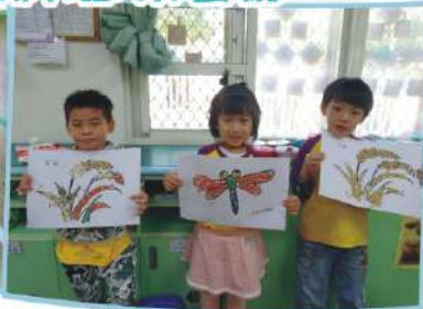
彩色米，拼貼成一幅畫