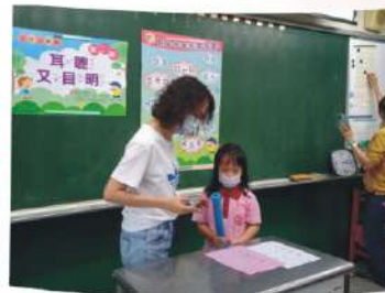
小一注音符號闖關