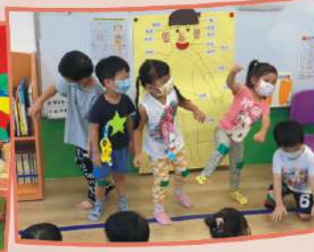
認識我的五官和身 體，動動手腳，保 持健康。