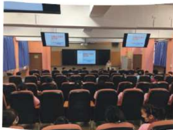
性別平等教育宣導